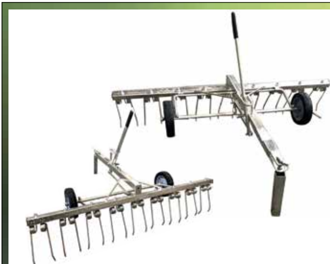
Gårdrive til plænetraktor 110 cm. DEKRAKE110