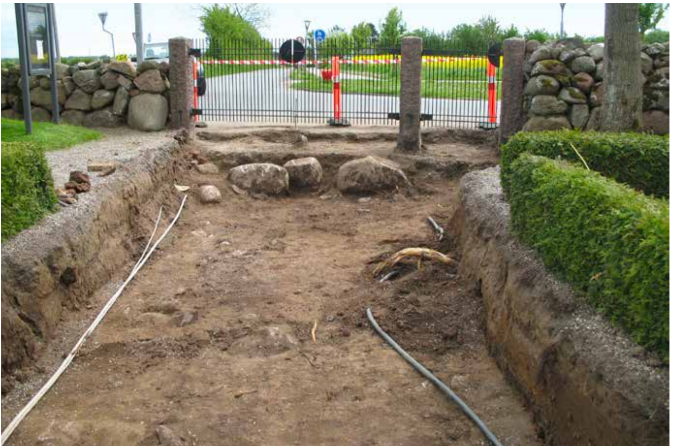
Herslev kirkegård ved Fredericia. Afgravning til fundering af ny belægning på hovedstien til kirken viste, at den sti altid har været der. Der er kun ganske få grave i stien, hvilket betyder, at denne sti har været benyttet stort set uafbrudt i 900 år. Det kan forekomme mærkeligt, da landsbyen ikke ligger syd for kirken. Det har den måske gjort for meget længe siden. Men nu ligger landevejen der. De store sten kan være fundering til en ældre portal.