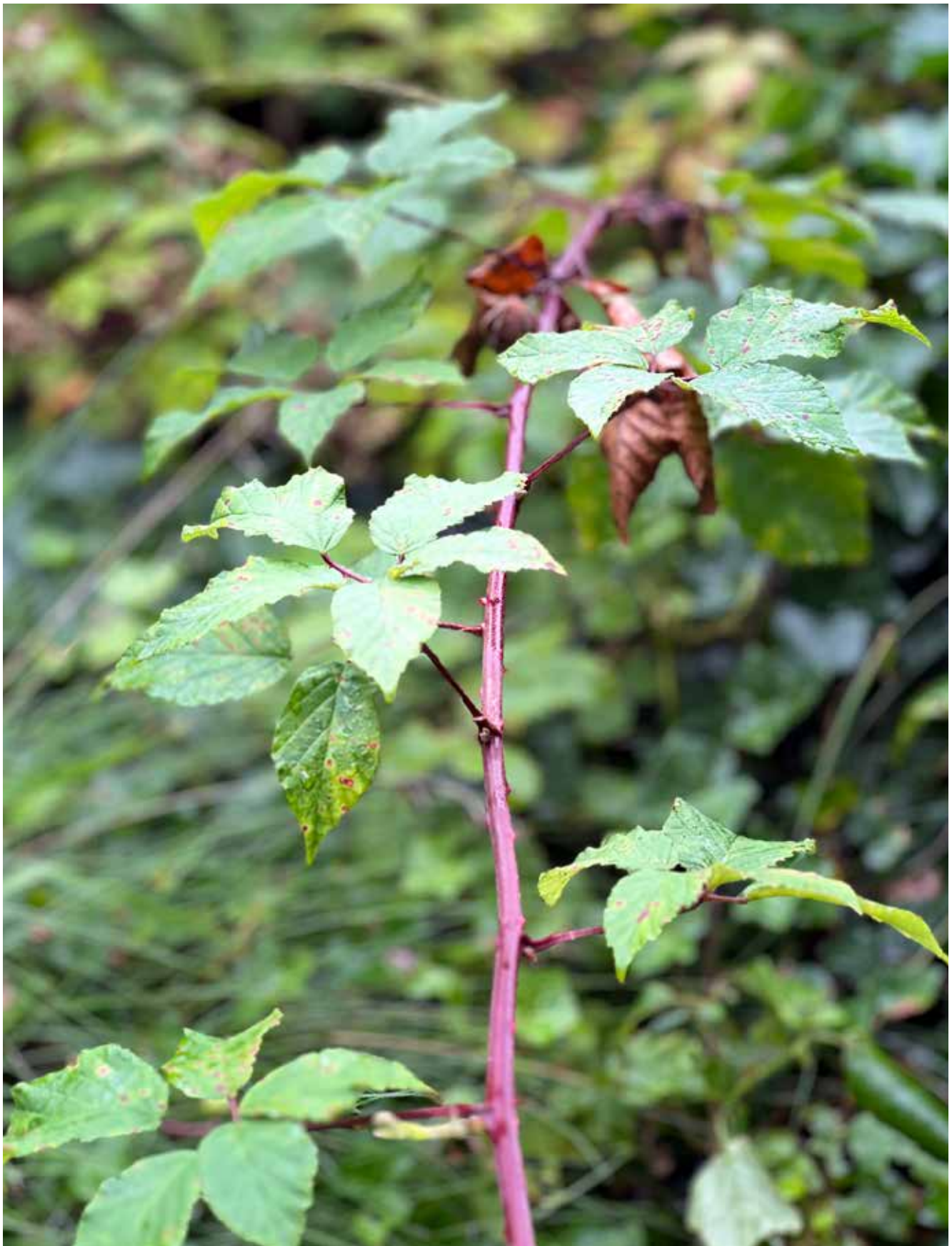
Brombær er ved at angribe forfatterens have fra naboflanken. Forsvaret er utilstrækkeligt.