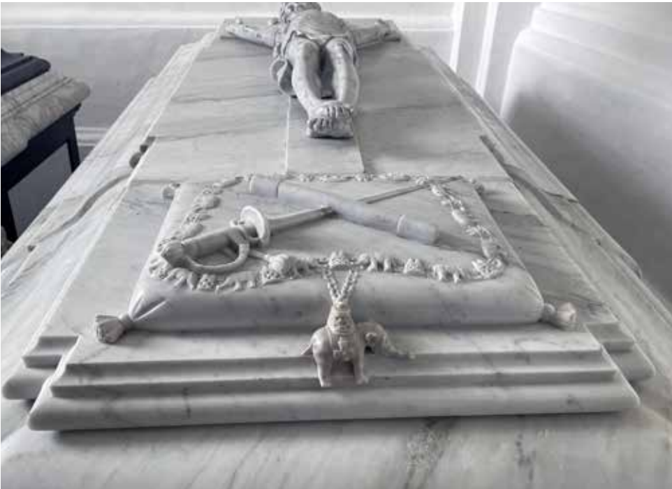
Den hvide sarkofag er udsmykket med elefantordenen, en kårde og noget, der måske er en marskalstav.