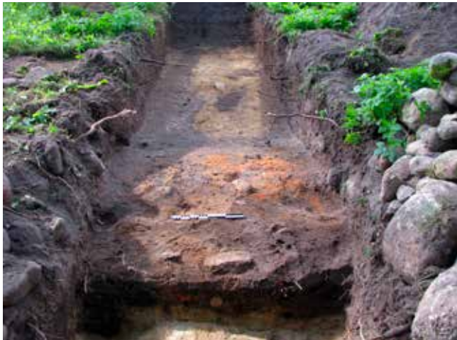
Testrup kirkegård. Lerovn under diget samt spor efter aktiviteter udenfor diget.