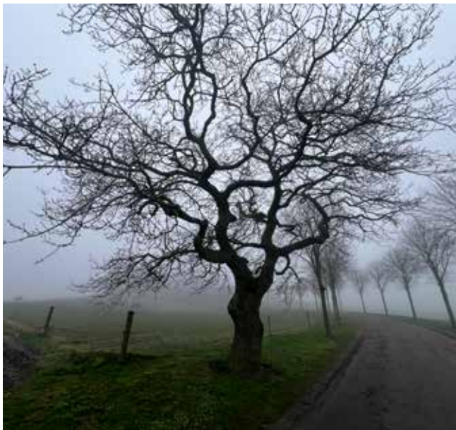
Det gælder om at vælge hjemhørende arter af fx træer.