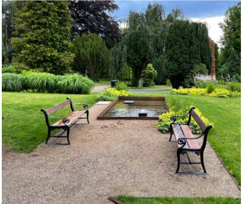
Den beroligende lyd af rislende vand kan nydes fra de opstillede bænke, der bliver flittigt brugt.