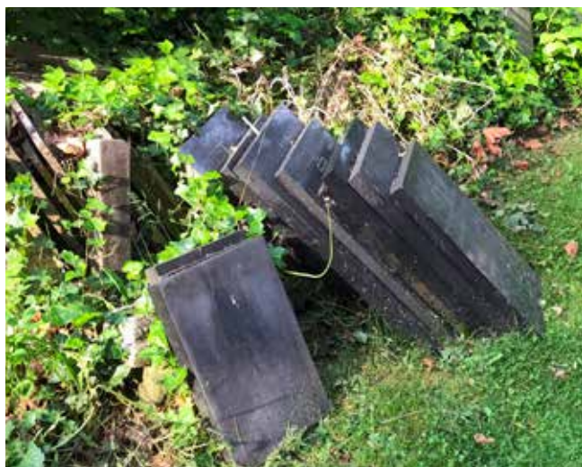
Kirkegården rummer mange skatte, der kan genbruges.

Tekst og foto: Lene Halkjær Jensen, Helsingør Kirkegård