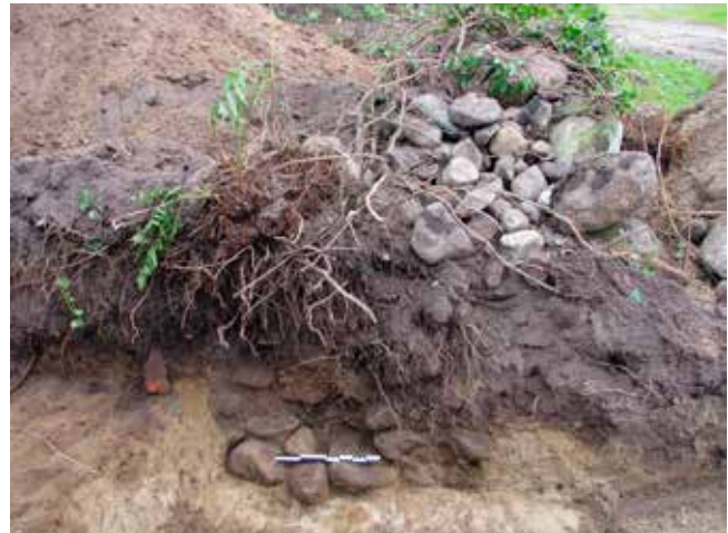
Testrup kirkegård. Nederst er fundering til ældre dige eller kirkegårdsmur.

mod anlæggelse af begravelser. Men det kan jo fx være en hovedsti fra landsbyen til kirken, som har ligget samme sted altid. Spor efter ældre kirkegårdsdiger eller -mure kan fortælle om sognets udvikling.