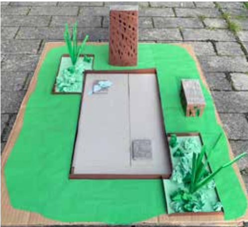
Vandspejlet er tegnet og udført af kirkegårdens egne medarbejdere.