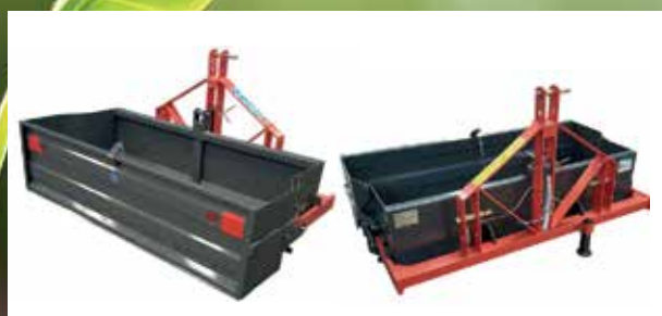
Bagtipskovl 120 cm Mek.tip med bagdør DEKL120DOOR