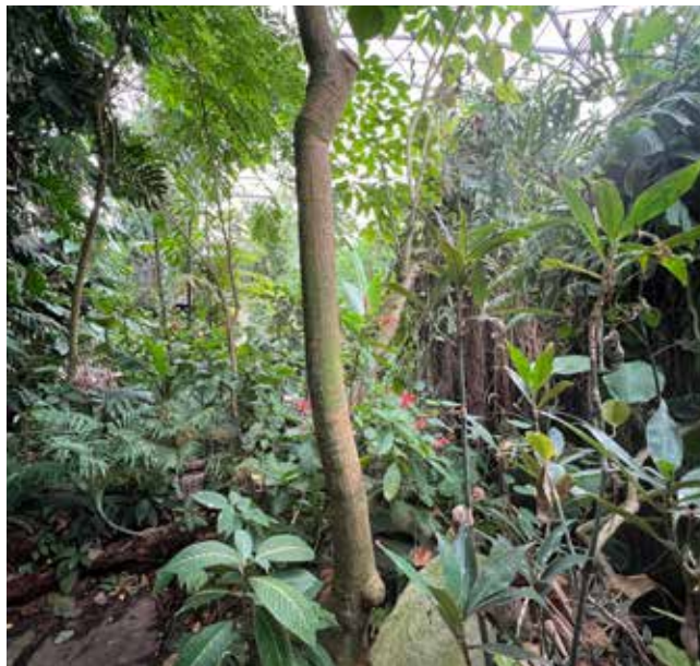
Det kan være noget af en jungle for ikke bare kirkegårde, men alle at finde en vej til at leve mere bæredygtig på. Vi danskere udleder rigtig meget CO 2 pr indbygger, og selv om vi ikke er mange, så er det alligevel vores ansvar at reducere vores udslip. Her kommer alle reduktioner i spil. Også dem når vi skal stedes til hvile.

Demonstrationsgravstederne er et resultat af et projekt, som er søsat af både Roskilde Stifts grønne omstillingsudvalg samt Grøn Kirke. Netop på hjemmesiden Gronkirke.dk kan alle læse mange forslag til, hvordan kirkerne kan blive mere bæredygtige. Fra hvordan kirkerne med fordel kan spare på elregningen og dermed formindske den enkelte kirkes CO 2 -udslip, til hvordan kirkens jorde kan bruges.