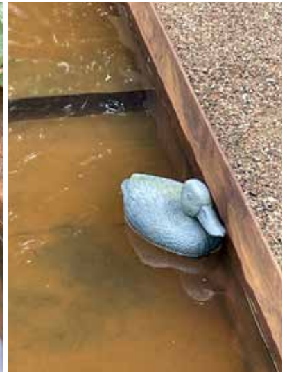
Det vides ikke hvem, der har hjulpet "andefamilien" med indflytningen, men det viser vel bare, at kirkegårdens besøgende har taget godt imod vandspejlet ☺

og fjerne blade o.a. fra bassinet. I varme og tørre sommerperioder, må det forventes, at der skal fyldes ekstra vand i bassinet med jævne mellemrum. Indtil nu har det dog ikke været nødvendigt; der har været "automatisk påfyldning" med meget jævne mellemrum.