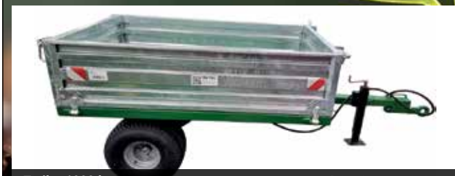
Trailer 1000 kg Flere modeller og størrelser på dk-tec.dk DEKTR1000