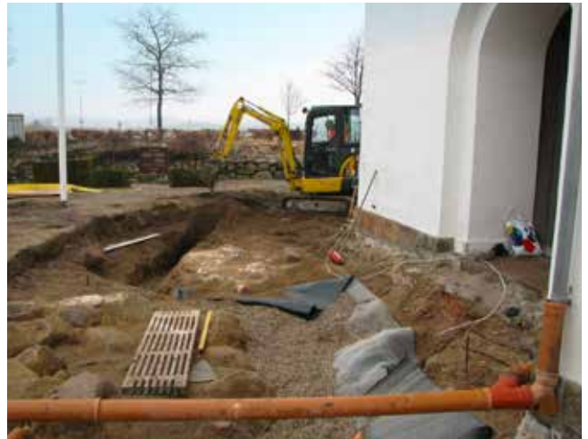
Hyllinge Kirke kirkegård. Kraftigt fundament til en bygning syd for tårnet, fundet i forbindelse med udskiftning af dårligt dræn med tilbageløb. Et tilsvarende fundament blev få år efter fundet på tårnets nordside i forbindelse med ny varmeledning. Publiceret i https://www.glossa.fi/mirator/pdf/ii-2015/kirkehyllingeandsnesere.pdf

Sandt: Nye rør er altid anderledes i tykkelse og evnen til at bøje, så det kan ikke lade sig gøre at grave lige i den gamle grøft. Desuden var der sandsynligvis ikke en arkæolog til stede, da de gamle rør blev lagt.