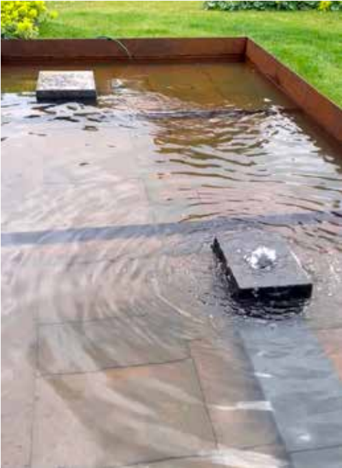
Vandspejlet er lavet af genbrugte gravsten og kanter af cortenstål.